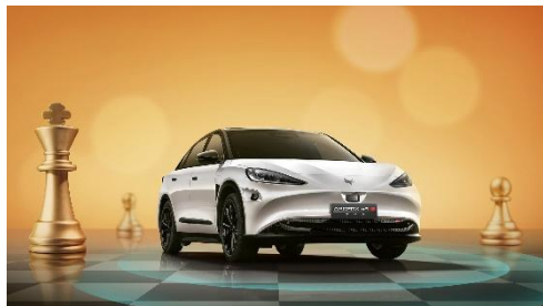
阿尔法 S 先行版 PRO

SUPERIOR 卓越系列音响，并拥有 20 万浓度前后排双出风负离子空气净化，提供尊贵舒适的驾乘体验。