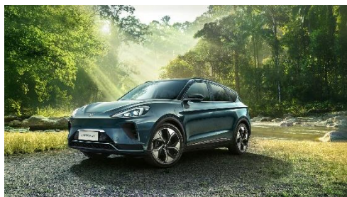
阿尔法 T 森林版 PRO

阿尔法 S 先行版 PRO 为极狐品牌与华为共同开发的高阶智能驾驶纯电轿车。它是全球首款搭载华为 HI 全栈智能汽车解决方案的豪华纯电轿车，是全国首款支持城市道路智能驾驶的车型，不依赖高精地图，覆盖城区主干路/次干路/支路、国道、县道、乡道。阿尔法 S 先行版 PRO 处于同级智能驾驶配置领先，搭载 3 个激光雷达、6 个毫米波雷达等共 34 颗高性能感知传感器，全感知范围达 2.5 个足球场，障碍物识别率 99.9%，可实现全域记忆泊车，如极窄单边距离 0.3m 车位，支持机械车位、异形车位、斜列车位等。阿尔法 S 先行版 PRO 搭载华为智能座舱鸿蒙 OS 系统，21.7 英寸 4K 视网膜大屏，可实现智慧语音、智慧手势等多模态交互手段。车辆配备全方位智能四驱控制系统，采用前交流异步+后永磁同步的双电机解决方案，零百公里加速 3.5 秒。车辆搭载国内首个 800V 高压超充平台，10 分钟补能 240km，自动识别并兼容公共快充桩，可实现多场景快速补电。整车采用航空级的全冗余设计，6 大安全防护盾，在主动安全、被动安全、救援安全、高压安全、信息安全和品质安全六大方面全时全域守护安全。其中，6 万牛米车身扭转刚度达到行业内领先水平。本产品拥有 2915mm 越级轴距，智能感应电动门，AR 激光投影感应尾门，全车舒享座椅，哈曼 Infinity 豪华音响系统等豪华细节。