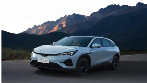
阿尔法 T5 25 款

阿尔法 T5 为一款超能纯电 SUV，以卓越的性能、出色的设计和先进的技术，引领着全优生超能纯电 SUV 的潮流，其拥有高强度钢铝车身，无限接近 0 醛 0 苯净味座舱，全车 26 项智能电动配置，用户可通过语音指令控制车辆，进行导航、音乐播放、车辆状态监测等操作，充分享受智能便捷。阿尔法 T5 采用宁德时代系列电池，拥有 660km 超长续航，百公里 13.9 度超低能耗和 0.245 超低风阻系数。该车型搭载了 800V 的高压平台技术，可实现 10 分钟补能 260 公里，补能效率大幅提升。