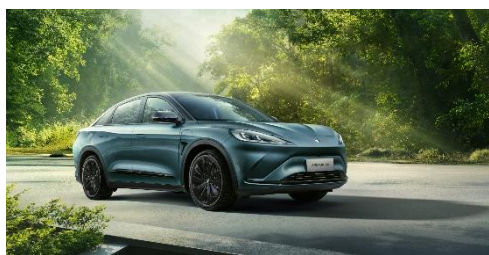
阿尔法 S 森林版 PRO

阿尔法 T 森林版 PRO 为一款全地形性能纯电中型 SUV，最长续航升级至 688km、零百加速 4.6 秒、自适应全地形控制系统及 One-Pedal 单踏板模式；拥有 L2+级 \alpha -Pilot 高级辅助驾驶系统及 23 个高精密度传感器，记忆泊车功能强大。在主动安全方面，拥有 AEB 自动紧急制动系统、前向碰撞预警系统 (FCW) 等 17 项主动安全技术、驾驶员疲劳/分心预警功能等，给驾乘者极致安全守护。内配备森林座舱的设计，车内采用环保材料，搭载 PM2.5+CN95 抗菌滤芯以及负离子发生器，可以达成 CN95 级空气净化能力。在舒适配置上，它提供了越级超大车内空间，后排超大可变空间至高可达 1357L，全车座椅加热、按摩功能、前排座椅记忆迎宾。豪华科技感方面，阿尔法 T 森林版 PRO 配备 20.3 英寸 4K 高清娱乐屏、哈曼 Infinity 12 扬声器豪华音响、AR 激光投影感应尾门、手机无线快充 50W 及后备厢 220V 电源，使车内秒变“沉浸式”多功能娱乐室。同时，它拥有高强度轻量化钢铝混合车身，55000 牛米车身扭转刚度，由全球知名豪华车制造商麦格纳品控加持。